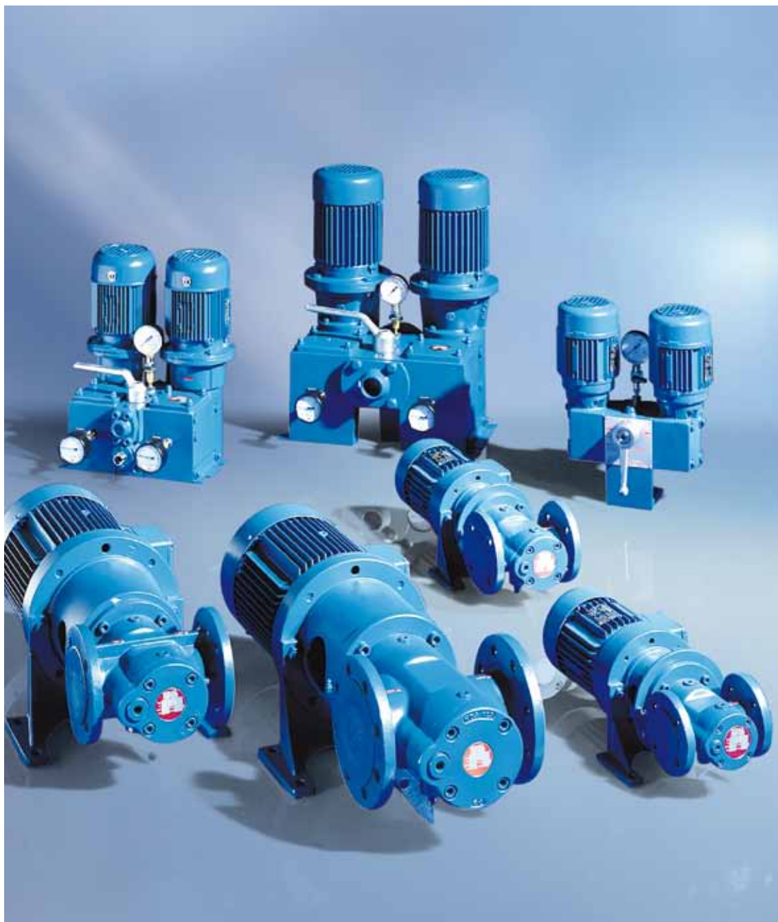
Примеры из серий K и DL /DS.