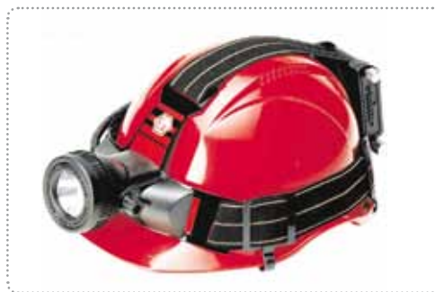
ГОЛОВНОЙ / НАШЛЕМНЫЙ ФОНАРЬ С ПОДЗАРЯДКОЙ WOLF HT-100

Имеет защиту от воды и пыли IP 54 в соответствии со стандартом EN 60529:1992. Имеет сертификат II 2 G EEx e ia IIC T3 IP54 ATEX. Соответствует для эксплуатации в средах Zone 1 & 2. Обеспечивает освещение источник света альтернативного типа с 5 светодиодами или вакуумный баллон накалывания. С поликарбонатной линзой, а корпус имеет термопластическое покрытие стойкое к ударам с антистатической защитой. Ni MN батарейка заряжается приблизительно за 4 часа, и ее можно заряжая использовать более 500 раз. Вес составляет приблизительно 325 грамм.