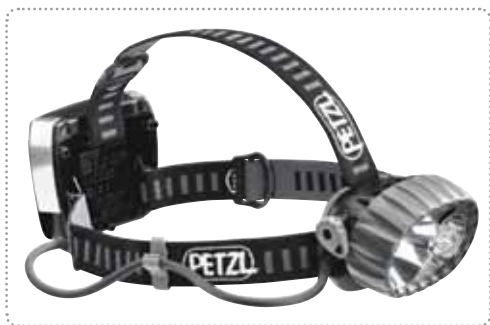
ГОЛОВНОЙ / НАШЛЕМНЫЙ ФОНАРЬ С ПОДЗАРЯДКОЙ WOLF HT-01

Имеет защиту от воды и пыли IP 66 в соответствии со стандартом EN 60529:1992. Имеет сертификат II 2 G Ex ib IIC T4/T3 IP66 ATEX. Соответствует для эксплуатации в средах Zone 1 & 2. Обеспечивает освещение с широким углом всего до 25 часов и до 4 часов с полной яркостью с источником освещения типа светодиода с высокой мощностью. С защищенной не бьющейся поликарбонатной линзой, а корпус имеет термопластическое покрытие стойкое к ударам с электростатической защитой. Работает с 3 штуками щелочных батарей типа AAA 1,5 вольт. Вес составляет приблизительно 90 грамм.