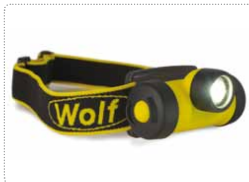
ГОЛОВНОЙ / НАШЛЕМНЫЙ ФОНАРЬ WOLF HT-400

Имеет защиту от воды и пыли IP 54 в соответствии со стандартом EN 60529:1992. Имеет сертификат II 1 G EEx ia IIC T4/T3 IP54 ATEX. Соответствует для эксплуатации в средах Zone 0,1 & 2. Обеспечивает освещение с широким углом всего до 240 часов и до 50 часов с полной яркостью с источником типа интенсивного светодиода количеством 7 штук. Работает с 3 штуками щелочных батарей типа AA 1.5 вольт. Вес приблизительно составляет 215 грамм.