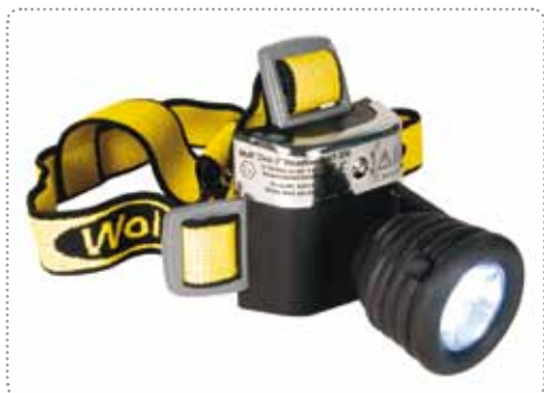
ГОЛОВНОЙ / НАШЛЕМНЫЙ ФОНАРЬ WOLF HT-200

Имеет защиту от воды и пыли IP 54 в соответствии со стандартом EN 60529:1992. Имеет сертификат II 1 G EEx ia IIC T4/T3 IP54 ATEX. Соответствует для эксплуатации в средах Zone 0,1 & 2. Обеспечивает освещение с широким углом всего до 240 часов и до 50 часов с полной яркостью с источником типа интенсивного светодиода количеством 7 штук. Работает с 3 штуками щелочных батарей типа AA 1.5 вольт. Вес приблизительно составляет 215 грамм.